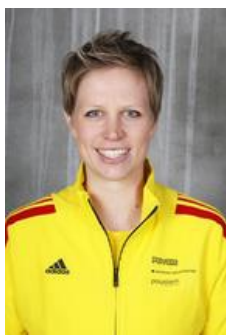
STV Willisau Kommunikation