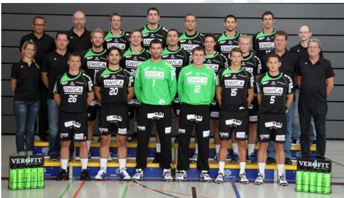
Das SHL-Team des HC Kriens-Luzern.

Die 1/16-Final-Partie im Schweizer Cup zwischen dem SHL-Team HC Kriens-Luzern und dem Fanionteam der Herren wurde angesetzt. Die Partie findet am Mittwoch, 20. Oktober 2010 (20.30 Uhr) in der Willisauer BBZ-Halle statt.